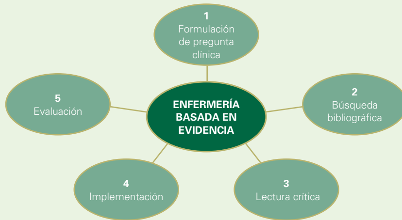
Figura 1. Etapas o fases de la EBE.

La evidencia científica va de la mano con el desarrollo profesional, el cual debe ser ético, eficaz, efectivo y eficiente. La enfermería no ha sido tradicionalmente una profesión “basada en la evidencia”, más bien la mayoría de las prácticas de enfermería son trabajos asentados en la experiencia y la tradición; razón de más para incorporar a la experiencia o maestría individual la mejor información científica disponible, con el fin de aplicarlo en la práctica clínica. La evidencia tiene un carácter dinámico, paralelo a la adquisición, aplicación y evaluación del conocimiento; este dinamismo le da flexibilidad y variabilidad; “ lo que hoy es evidente puede que mañana no lo sea ”. Florence Nightingale (siglo XIX) fue la primera en observar que es esencial conocer el resultado de cada intervención para planificar los cuidados más efectivos, defendió la evaluación de la investigación para ganar conocimiento sobre lo que es mejor y lo que no para los pacientes. 1 A inicios de los años 90’s, la Medicina Basada en la Evidencia (MBE) se convierte en un movimiento científico y profesional promulgado por Sackett , que vertiginosamente se ha diseminado por todo el mundo dando origen a la EBE pero, ¿qué es la Enfermería Basada en la Evidencia?